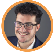
Emanuele Bompan Environmental & Circular Economy Expert